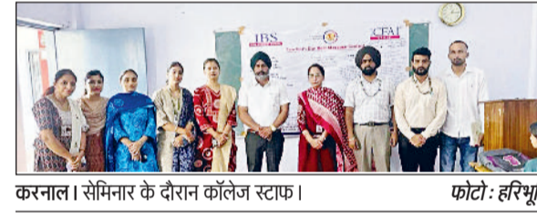
करनाल। सेमिनार के दौरान कॉलेज स्टाफ।