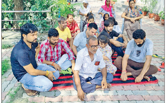
घरोड़ा। पानी की समस्या को लेकर घरने पर बैठे कॉलोनीवासी।

घरों के पानी के ओवरफ्लो होते ही सीवरेज लाइनें जाम हो जाती हैं और गंदा पानी गलियों से होते हुए सीधे घरों में घुस जाता है। इससे जहां आवागमन पूरी तरह बाधित हो जाता है, वहीं गंदगी और दुर्गंध से छोटे बच्चों और बुजुर्गों की सेहत पर बुरा असर पड़ रहा है। स्थानीय नागरिकों का कहना है कि वे कई बार नगर पालिका और जन स्वास्थ्य विभाग को शिकायत कर चुके हैं। हर बार विभाग केवल दिखावाटी मरम्मत करके चला जाता है, लेकिन कुछ ही दिनों में समस्या दोबारा खड़ी हो जाती