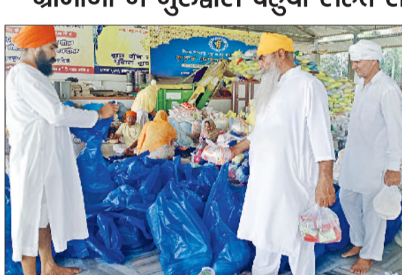
पानीपत। इसराना गुरुद्वारा साहिब में बाढ़ पीड़ितों के लिए राहत सामग्री का लदान करते हुए सेवादार आदि।

मची तबाही से पंजाब में राहत सामग्री भेजे जाने का कार्य चल रहा है। इसराना व आस पास के गांवों से ग्रामीण राहत सामग्री से भरी ट्रेक्टर ट्रालियां को गुरुद्वारा इसराना साहिब में इकट्ठी की हुई थी अब इसके पैकेट की पैकिंग कर राहत सामग्री बाढ़ पीड़ितों के लिए भेजने का काम शुरू हो गया है। मंगलवार को गुरुद्वारा इसराना साहिब में सेवादारों के साथ अन्य ग्रामीणों ने भी गुरुद्वारा पहुंची राहत सामग्री की किट बनाने का कार्य शुरू कर दिया है। किट में चीनी, चावल, दाल, बिरिकट, चाय, टूथपेस्ट, साबुन व दवाइयों के साथ अन्य जरूरी सामान शामिल किया गया है। इसी दौरान जाट आरक्षण संघर्ष समिति के