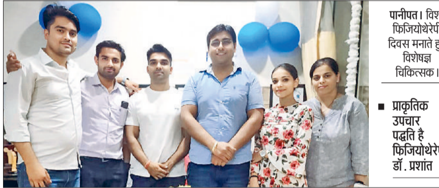
पानीपत। विश्व फिजियोथेरेपी दिवस मनाते हुए विशेषज्ञ चिकित्सक।