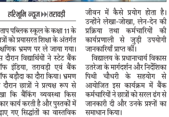
हरिभूमि न्यूज ▶▶ तरावड़ी

प्रताप पब्लिक स्कूल के कक्षा 11 के छात्रों को प्रयासरत शिक्षा के अंतर्गत शैक्षणिक भ्रमण पर ले जाया गया। इस दौरान विद्यार्थियों ने स्टेट बैंक ऑफ इंडिया, तरावड़ी एवं बैंक ऑफ बड़ौदा का दौरा किया। भ्रमण के दौरान छात्रों ने प्रत्यक्ष रूप से देखा कि बैंकिंग व्यवस्था किस प्रकार कार्य करती है और पुस्तकों में पढ़ाए गए सिद्धांतों का वास्तविक