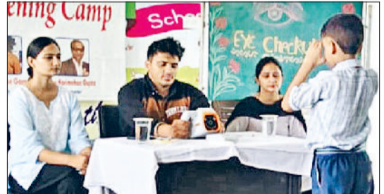
पानीपत। संस्कृति पब्लिक स्कूल गांव खंडरा में छात्र की आंखें जांचते हुए विशेषज्ञ।