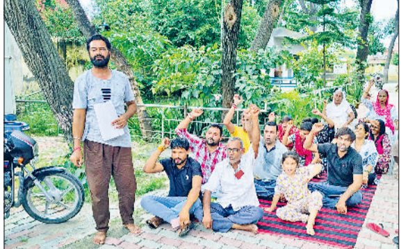
घरोड़ा। पानी की समस्या को लेकर प्रदर्शन करते कॉलोनीवासी।

शहर के वार्ड नंबर 15 तेलु सिंह कॉलोनी और आसपास के इलाकों के लोग बदहाल सीवरेज व्यवस्था से त्रस्त होकर आखिरकार सड़कों पर उतर आए। सोमवार को वार्डवासियों ने जन स्वास्थ्य विभाग कार्यालय के बाहर तीन घंटे तक धरना प्रदर्शन कर विभाग के खिलाफ जोरदार नारेबाजी की। आक्रोशित लोगों ने विभाग पर गंभीर लापरवाही का आरोप लगाते हुए चेतावनी दी कि यदि जल्द ही स्थानीय समाधान नहीं किया गया तो आंदोलन को बड़े स्तर पर अंजाम दिया जाएगा। वार्डवासियों ने बताया कि पिछले दो वर्षों से इलाके में सीवरेज व्यवस्था पूरी तरह ध्वस्त है। हल्की सी बरसात या