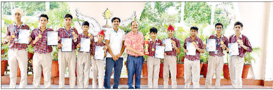
अंबाला। प्रतियोगिता में बाजी मारने वाले छात्र।

पुलिस डीएवी पब्लिक स्कूल के युवा कूडो चैंपियनशिप में एक बार फिर अपने स्कूल और जिले का नाम रोशन किया है। अंबाला छावनी के सुभाष पार्क में आयोजित 6वीं हरियाणा राज्य कूडो प्रशिक्षण सैमिनार एवं जापानी मार्शल आर्ट्स कांबेट स्पोर्ट्स टूर्नामेंट में खिलाड़ियों ने शानदार प्रदर्शन करते हुए 11 स्वर्ण, 2 रजत और 1 कांस्य पदक जीते। इस उत्कृष्ट उपलब्धि की। साथ ही जिले में ओवरऑल द्वितीय ट्रॉफी अपने नाम की। इस प्रतिष्ठित चैंपियनशिप में 15 जिलों के लगभग 300 खिलाड़ियों ने भाग लिया। सभी स्वर्ण और रजत पदक विजेता अब राज्य का प्रतिनिधित्व आगामी कूडो नेशनल चैंपियनशिप,