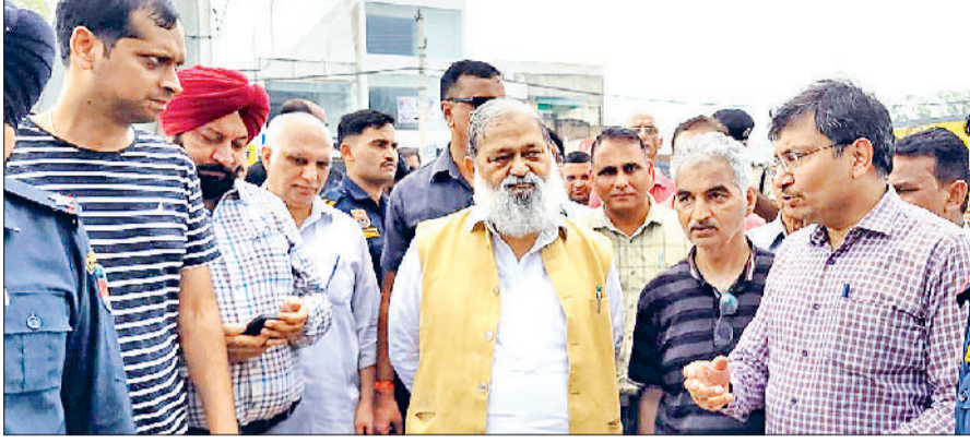
अंबाला। इंडस्ट्रियल एरिया का जायजा लेने पहुंचे मंत्री अनिल विज।

बताया है। इसके लिए उन्होंने इंडस्ट्रियल एरिया के चारों तरफ स्ट्रीट लाइट लगाने के लिए अपने स्वीच्छक कोष से 30 लाख रुपए जारी किए हैं। वह चाहते हैं कि इंडस्ट्रियल एरिया एसोसिएशन चारों ओर दीवार पर सीसीटीवी कैमरे में लगवाए जिससे उसीके सामान की सुरक्षा होगी। उन्होंने कहा कि इंडस्ट्रियल एरिया हमारे आसपास क्षेत्र के लिए लाइफलाइन है। यहां वस्तुओं उत्पादन और हजारी लोगों को रोजगार मिलता है। उन्होंने बताया कि पानी निकासी को लेकर वो बीते तीन दिनों से लगातार इंडस्ट्रियल एरिया में आ रहे हैं। उन्हें उम्मीद है कि कर शाम तक यहां से पूरा पानी