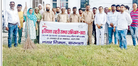
करनाल। हरियाणा शहर स्वच्छता अभियान के तहत सफाई अभियान में जुटे नगर निगम के सफाई कर्मचारी।

राम नगर का हनुमान मंदिर और सनातन धर्म मंदिर व आसपास के क्षेत्रों की सफाई की गई। उन्होंने बताया कि इस दौरान जन-जागरूकता अभियान, सार्वजनिक शौचालयों की सफाई, जीरो वेस्ट कार्यालय की