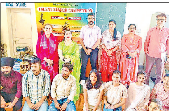
राहजादपुर। विभिन्न प्रतियोगिताओं में बाजी मारने वाले छात्र शिक्षकों के साथ। प्रतियोगिताओं जैसे काव्य पाठ, भाषण, चित्रकारी, संगीत वादन